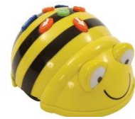
Bee-Bot programmeren in de klas

Wij willen alle mensen die onze school gesteund hebben op het mossel-feest van harte bedanken. Met de opbrengst kopen we dit jaar laptops en Bee-Bots aan. Deze zullen in de klas ingezet worden om onder meer programmeervaardigheden aan te leren.